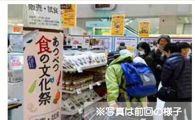
※写真は前回の様子