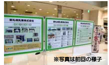
※写真は前回の様子

食品企業やその製品を、パネルや大型ディスプレイで紹介します。 今年はパネルで楽しむ工場見学体験も！ 企業ヒミツが明かされる!? また、高校やホテル等の活動も紹介します。