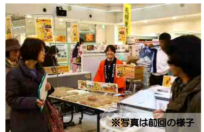
※写真は前回の様子

今年はコラボ弁当も販売します！ 高校生が店頭に出ます！ どんな食品かは当日までのお楽しみ♪